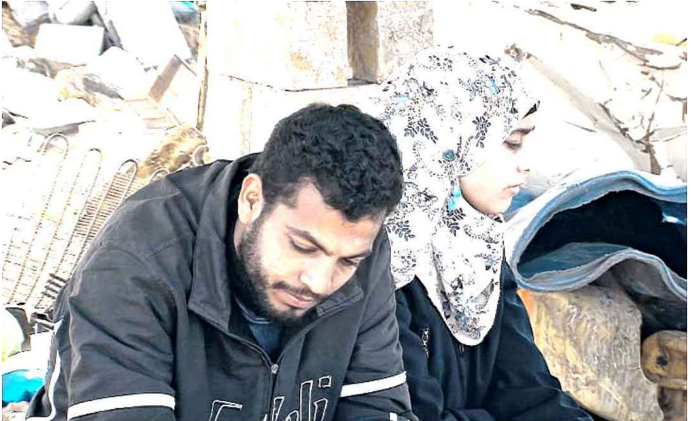
Mêlant prises de vues réelles et scènes animées, Samouni Road est une œuvre indispensable.

plusieurs mois à partir des images que j'avais tournées pour Plomb durci et celles captées lors de mon immersion dans la famille Samouni, mais cela ne fonctionnait pas. Je ne voulais pas réaliser un énième film de dénonciation. Les témoignages allaient bien au-delà. J'ai voulu rendre vie à des êtres singuliers, morts ou vivants, à une histoire singulière, complexe et passionnante.