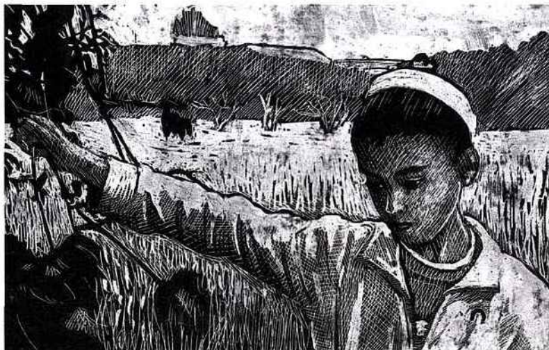
Pour dire l'épouvante d'une attaque de Tsahal, des images d'animation en noir et blanc.