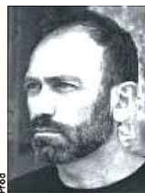
Stefano Savona Réalisateur

plusieurs mois à partir des images que j'avais tournées pour Plomb durci et celles captées lors de mon immersion dans la famille Samouni, mais cela ne fonctionnait pas. Je ne voulais pas réaliser un énième film de dénonciation. Les témoignages allaient bien au-delà. J'ai voulu rendre vie à des êtres singuliers, morts ou vivants, à une histoire singulière, complexe et passionnante.